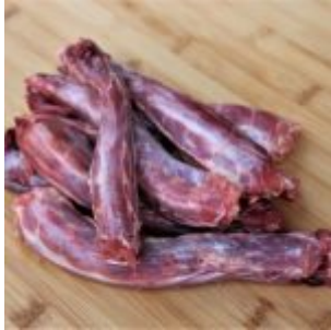
Cou (Yummy Barf)