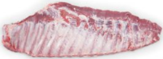
Plat de côtes