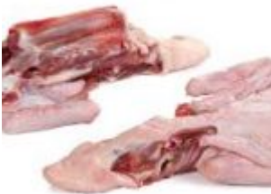
Carcasse (Dog's Kitchen.be)