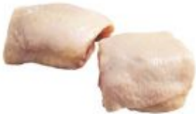
Haut de cuisse