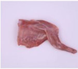
Patte avant ou avant (gigolette)