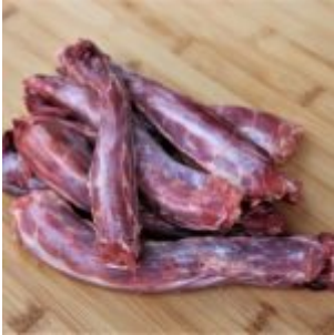
Cou (Yummy Barf)