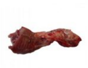
Avant de lapin avec tête (Barf Discount)