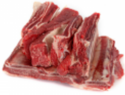
Plat de côte