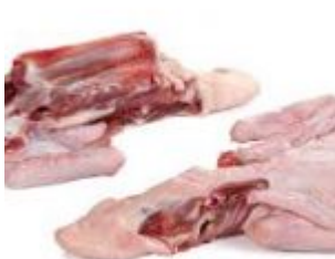
Carcasse (Dog's Kitchen.be)